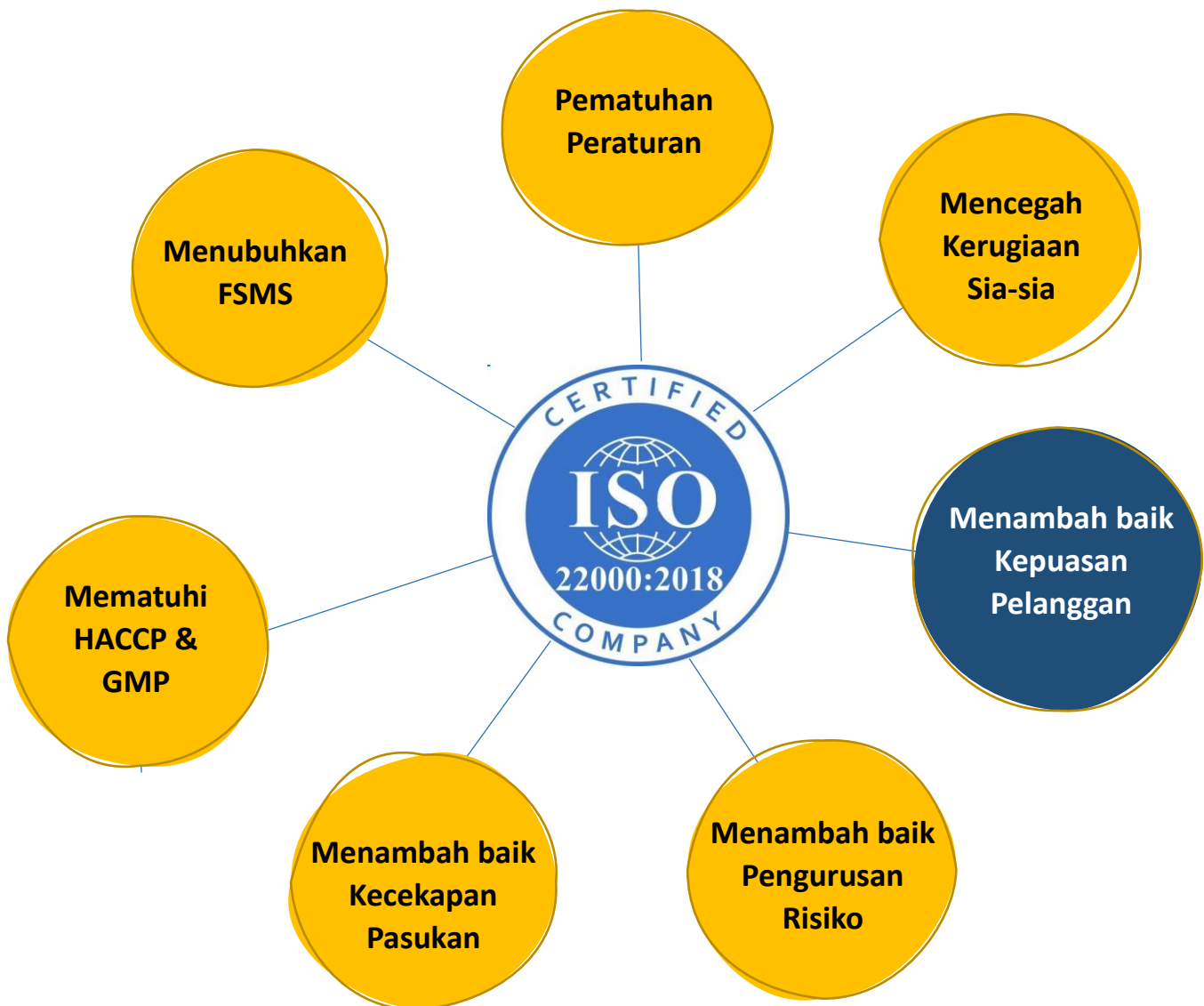
Manfaat utama ISO 22000:2018