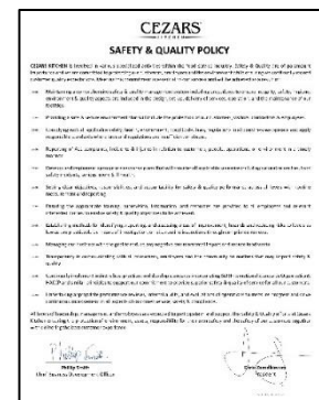
Polisi Keselamatan & Kualiti. Page 4 & 5