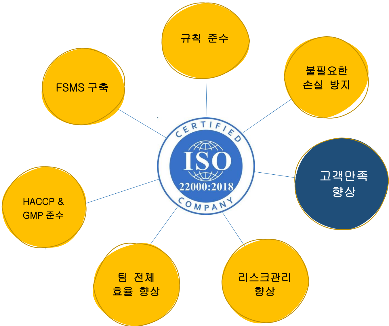
ISO 22000:2018 의 주요 베네핏