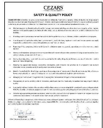
안전 및 품질 정책 4-5페이지